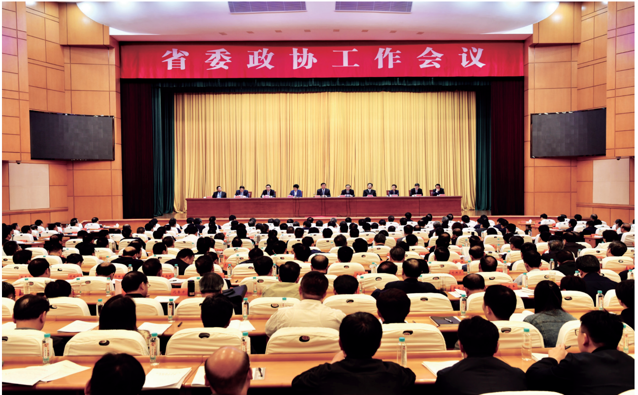
10月21日，省委在宁召开政协工作会议，深入贯彻习近平总书记在中央政协工作会议暨庆祝中国人民政治协商会议成立70周年大会上的重要讲话精神，全面落实中央政协工作会议精神，部署我省新时代加强和改进人民政协工作。省委书记娄勤俭出席并讲话，省长吴政隆主持会议。